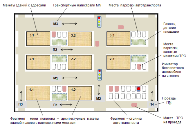
Рисунок 1 – Динамический архитектурный макет городской среды, вариант 1, базовый

шаются различные задачи, определяются, уточняются траектории движения, связанные с объездом препятствий, с корректировкой положения имитатора ТРС при парковке.