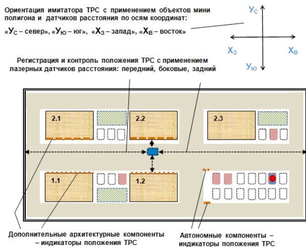
Рисунок 2 – Пространственная ориентация имитатора беспилотного ТРС на мини полигоне