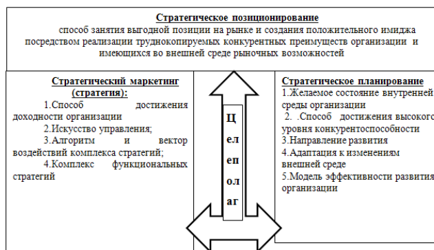
Рис. 1. Подсистемы стратегического управления

Новизна проблем стратегического управления как источника труднокопируемых конкурентных преимуществ определяет необходимость его дальнейшего исследования.